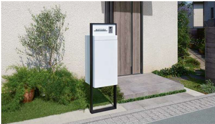
※上記写真は参考写真となります